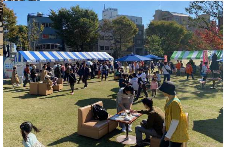
令和6年度 ぎふ信長まつり 金公園「あおぞら喫茶ぎふ～with 一宮～」 開催時の様子