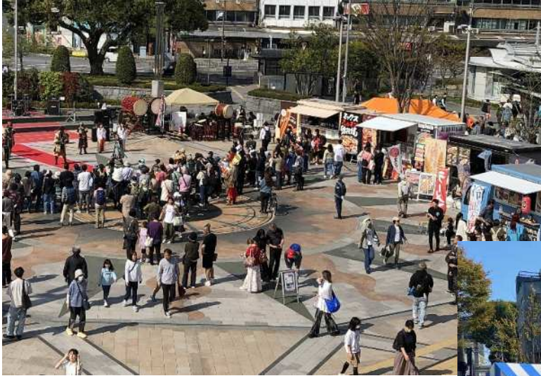
令和6年度 道三まつり 岐阜駅前北口駅前広場の様子