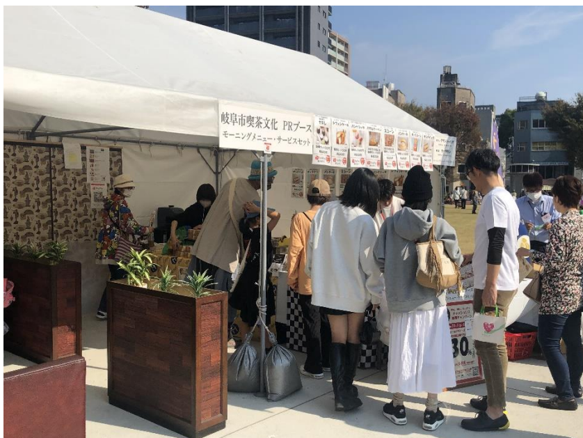
令和6年度 道三まつり 「岐阜市喫茶文化 PR ブース」の様子